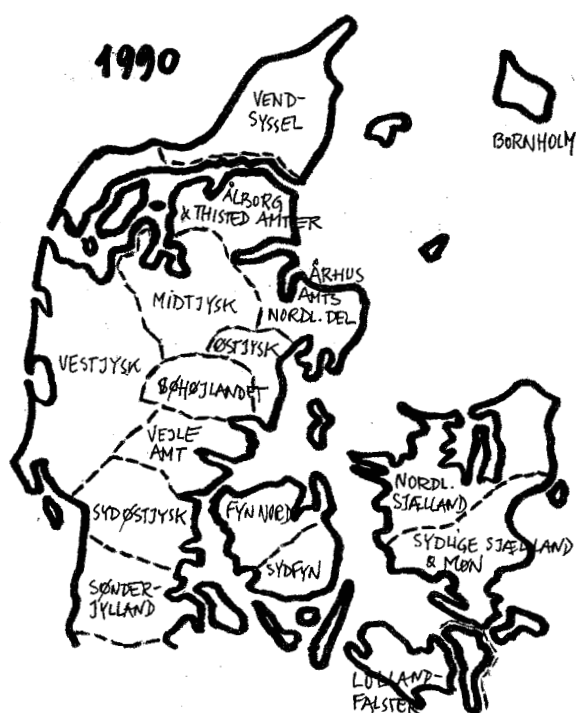
Skovdyrkerne anno 1990. Tegningen viser situationen hos Skovdyrkerne for 25 år siden. Bortset fra den dengang nydannede forening i Vestjylland ser man de mange små foreninger, både på øerne og i det jyske område.

Bestyrelser og ledelse i skovdyrkerforeningerne Midtjylland og Østjylland er blevet enige om at skabe en større og stærkere forening i Midtjylland ved at sammenlægge de to nuværende foreninger. Med den foreslåede sammenlægning vurderer Skovdyrkernes landsformand, Torben Bille Brahe, at mere end 25 års strukturudvikling hos Skovdyrkerne er til ende.