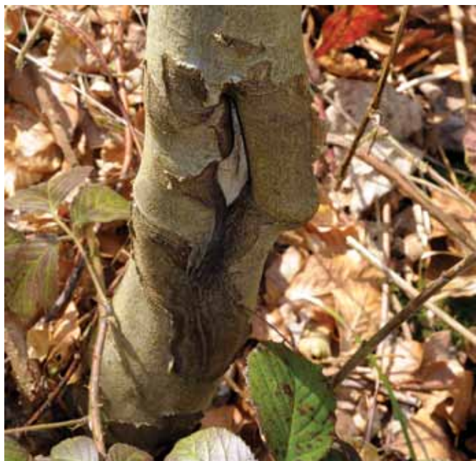
Fejeskade i bøg. En sådan skade vil følge træet i hele dets levetid, og vil være kvalitets- og dermed prisnedsættende i den sidste ende. Dåvildtet koster.

Der er i øvrigt igen ansat en skytte på Hverringe. Han er natur- og vildtforvalter, sælger ydelser til og servicerer de 5-6 jagtkonsortier samt står for afskydningen af dåvildt på øen Romsø (oprindeligt dåvildt udsat i 1200-tallet, da dåvildtet var en eksotisk vildtart). Jagtlejerne ønsker udsætning af et moderat antal fasaner, og kyllinger og pasning købes af skytten, men selve jagtdagene afholder konsortierne selv. Udover at sikre at jagtlejerne er glade kunder, der får værdi for pengene og gode jagtoplevelser, sikrer skytten, at alt vedrørende jagten kører efter bogen. Overholdelsen af de stadig mere omfattende og komplicerede regler og sikring af de nødvendige