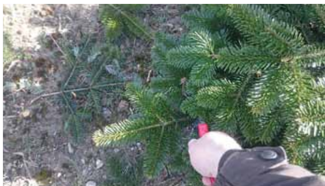
Billede 2: To årsskud klippes af kransene nedenunder.