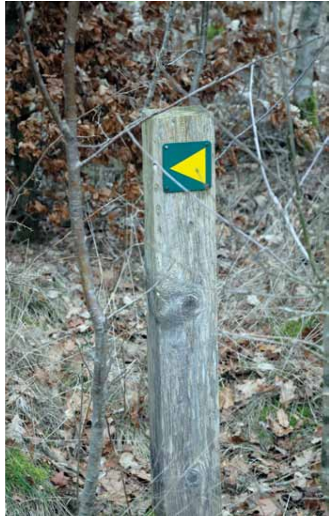
De standardmaterialer somskal bruges i forbindelse med et "spor i landkabet" produceres centralt og købes ind til projektet.

Flere oplysninger om de lokale stianlæg kan findes på hjemmesiden www.spor.dk .