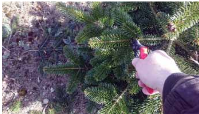
Billede 1: Et årsskud klippes af den næstøverste grenkrans.

I denne sæson følger yderligere på vores hjemmeside en række faktaark om de almindelige indgreb, som kan læses og printes ud. Så kan de jo tages med ud til egen gavn eller til instruks af arbejderne.