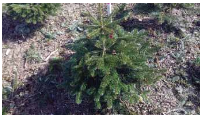
Billede 3: Her ses træet lige efter grundklipningen.