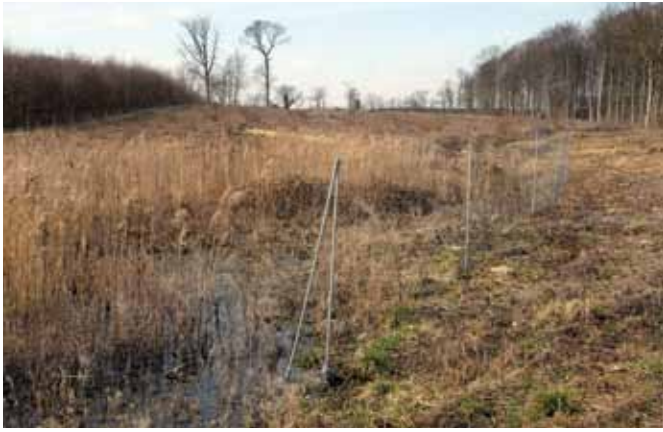
En stor hegning er gennembrudt af en vildtpassage, som er placeret, hvor et vådbundsareal alligevel ødelægger trævæksten.

I en enkelt kultur var hegnet sat to måneder efter plantingen. Her havde dåvildtet allerede nået at lave omfattende bidskader. Som vi nævnte i et par artikler om kronvildt i sidste nummer af Skovdyrkeren , så kræver også dåvildtet en afskydning, som aftales på tværs af ejendomsgrænser, f.eks. i et såkaldt jagtlaug.