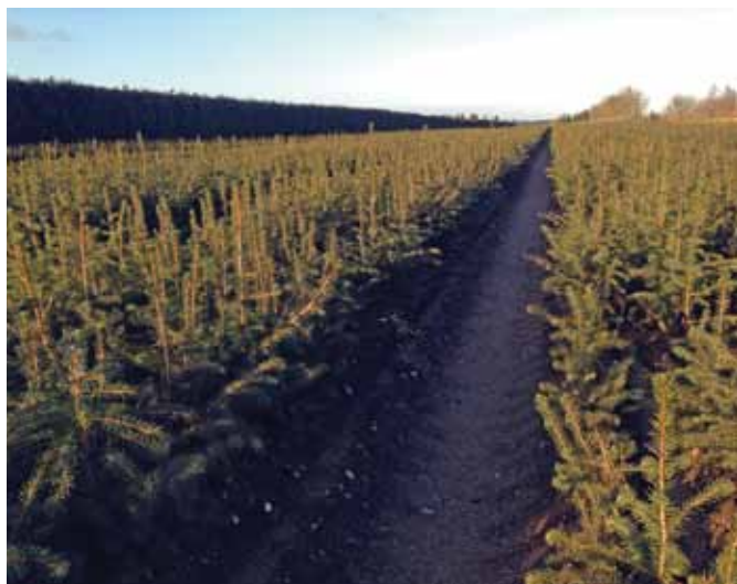
Sitkagran – skovejernes foretrukne træart anno 2015.

Det kan blandt andet afspejle en optimisme og en tro på skovbruget som erhverv og ikke kun som en passiv (men herlig) fritidsbeskæftigelse. Hvis man ser på tilvæksttallene for de enkelte arter, som vi bragte i forrige nummer af Skovdyrkeren i artiklen om Torben Brüel, så giver ændringen også god mening rent økonomisk.