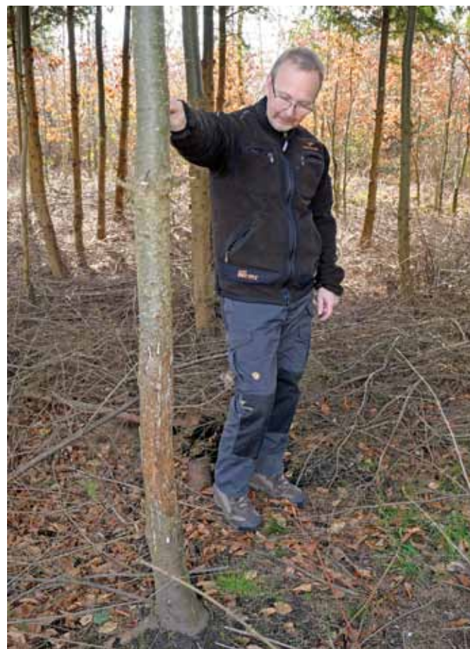
En 8-årig douglasbevoksning er opstammet med henblik på fremtidig værdiproduktion. Men desværre blev opstamningen straks fulgt op af en dåvildtskrælning.

På distriktet ses meget gammel bøg, og man kunne tro, at selvfor yngelse var en fornuftig foryngelsesmåde. Det er det ikke. Vi besigtiger distriktets eneste selvfor yngelse, som er plantefattig på trods af, at man i en længere periode har suppleret med overskudsplanter fra andre plantninger. Hvis overstandermassen i selvfor yngelserne holdes på det rette niveau i forholdet til bundvegetationen, så trykkes kulturerne af overstanderne. Og hvis der lysnes mere, så vælter brombærrene ind over arealerne. Derefter kommer musene, og altså til sidst dådyrene. Derfor bliver alle kulturer nu lavet som plantninger efter renafdrift. Kvalitetskulturer med de bedste provenienser skal sikre fremtidens indtægter.