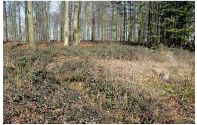
En af Ægyptens syv plager: Brombær. Her ses opvækst af brombær kun et år efter lysstilling.

Ejendommens nøgleord synes at være ordentlighed, bæredygtighed og kvalitet. Skoven er overalt velpasset. Her ses mange gamle grøfter, som vedligeholdes for at holde de mange bøgebevoksninger sunde og stormfaste. Man er dog enige om, at der er plantet for lidt nåletræ