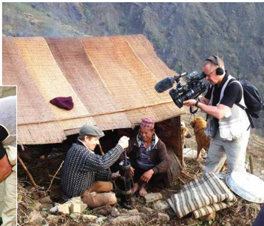
Hvorfor ikke kærne sit eget smør? Den nepalesiske bonde har vist aldrig haft andre muligheder.