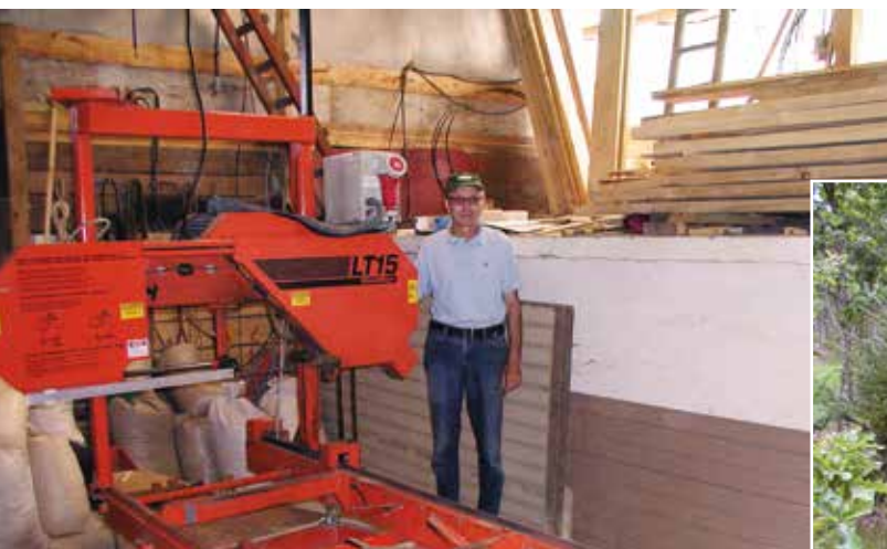
Savværket hvorpå der skæres gavntre. Nogle af produkterne ses oppe til højre i billedet.

I nyere tid også som savskåret træ – opskåret på eget savværk og som flis i det nyetablerede flisfyret. Flisfyret er installeret for at lette arbejdsbyrden og udnytte brændet bedre. Med det øgede skovareal og en bedre udnyttelse af energitræet sker der dog en opsparring af vedmasse i skoven, så der en dag også skal sælges træ fra skoven.