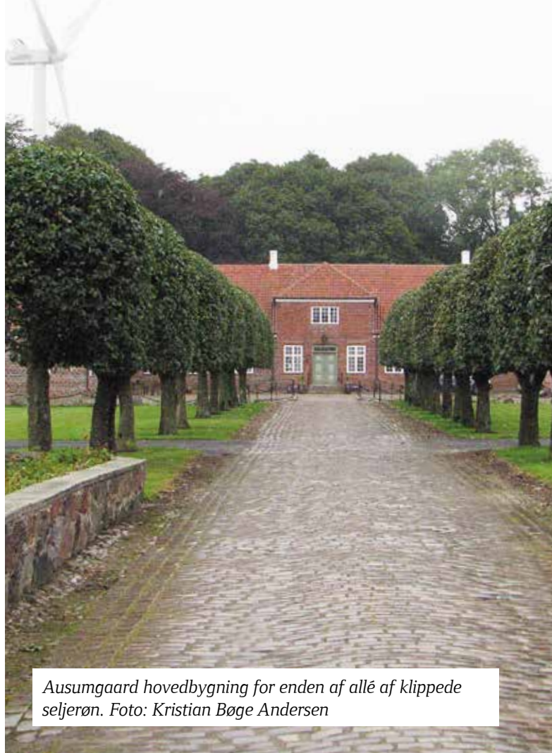
Ausumgaard hovedbygning for enden af allé af klippede seljerøn.