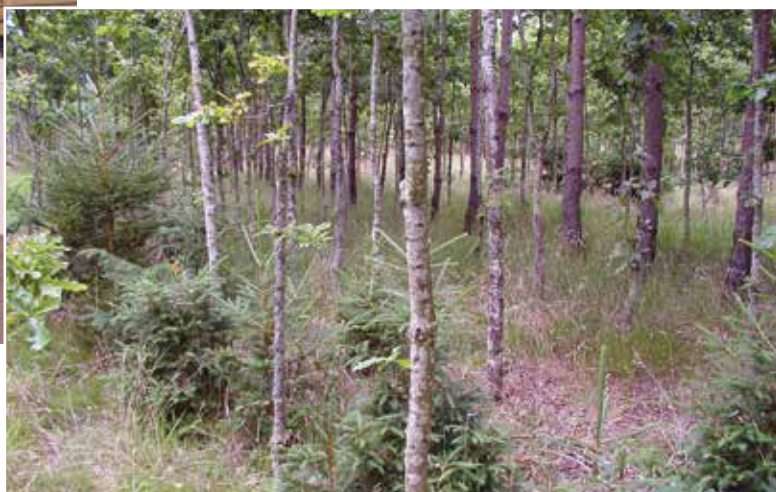
Skovrejsning med eg som hovedtræart. Nåletræ selvsår sig ind på de mest tørre og næringsfattige pletter. Naturlig og kærkommen forøgelse af diversiteten.

Efter 3 år var rugen væk, og der blev samtidig renholdt med kultivator og hakkejern. Gennem tiden er der klippet tveger og opstammet, så der i dag efter næsten 17 vækstsæsoner kan udpeges hovedtræer i egne på de bedste dyrkningspletter. De helt tørre, sandede områder har svært ved at sikre vand og næring nok til egne, men her kommer diverse selvsået nåletræ.