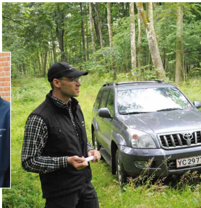
Skovfogedens hverdag 2: De kommende aktiviteter diskuteres undervejs, ningen efter et afsluttet flisprojekt på 5.320 rummeter.