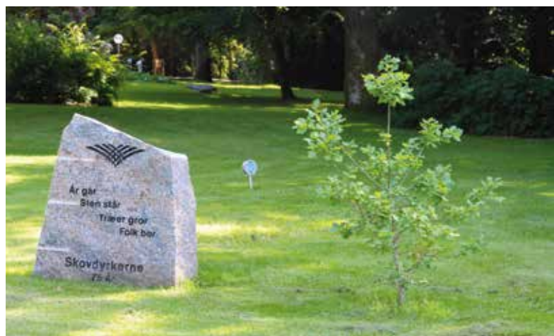
Afkommet af kongegegen, som Skovdyrkerne plantede den 14. april i år, gror godt ved siden af stenen, som blev sat samme dag.