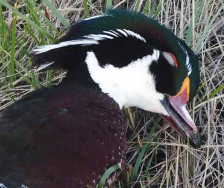
Stort hoved med et kort og farverigt næb og en fjertop i nakken er helt karakteristisk for brudeanden.