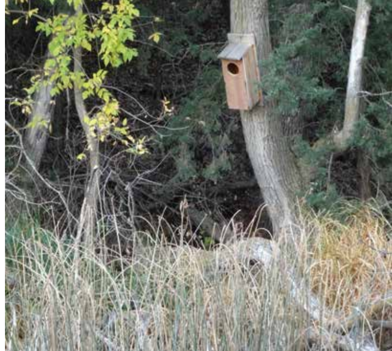
Bag den store stigning i brudeændernes antal står de mange redekasser der opsættes overalt i USA.

Gesvindte er de, disse fugle, for så snart jeg rejser mig op, er de på vingerne. Mit første skud gælder andrikken, men det må være et forbiskud, for den fortsætter ind mellem træerne. Samtidig letter en hun fra rørene og går mod venstre. Jeg rammer den mellem træerne, hvor den falder. Ved det næste vandhul letter en andrik fra sivene, desværre på for langt hold. Heldigvis drejer den rundt i en cirkel inde mellem træstammerne, og kommer derfor snart på skudhold igen. Da der er et lille ophold i de tætte trækroner, slår jeg til, og den tumler