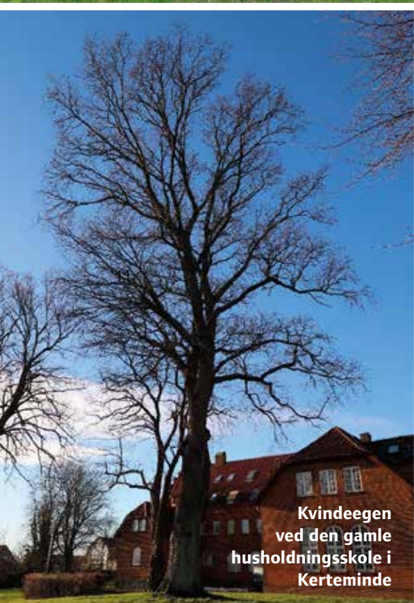
Kvindeegen ved den gamle husholdningsskole i Kerteminde