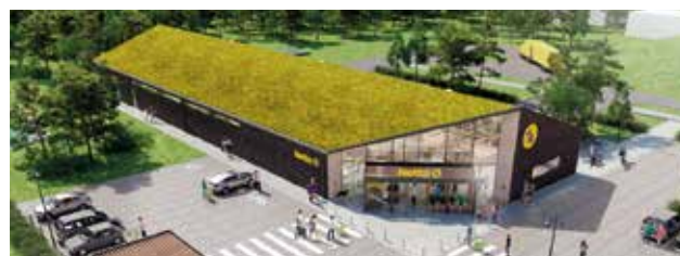
Illustration: C.F. Møller Architects

- Vi er stolte over at kunne bi- drage til Netto og Salling Groups visioner om en mere bæredygtig fremtid ved sammen at udvikle