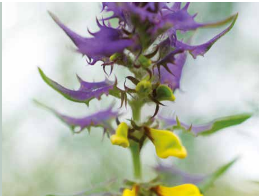
Blåtoppet kohvede er sjælden og findes normalt kun på Sjælland. Her er den med stor succes sået ud i en skovrejsning. Det er en snylter, hvis frø spredes ved hjælp af myrer.

Hvis de rette fødeplanter findes, og biotopen i øvrigt er tæt på rigtig, kan man have gode chancer for succes med udsætning af sommerfuglelarver. Vil man nyde synet af den overvintrede citronsommerfugl i det tidlige forår, er det en forudsætning, at der findes tørsttræer