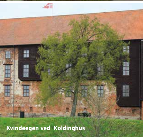
Kvindeegen ved Koldinghus