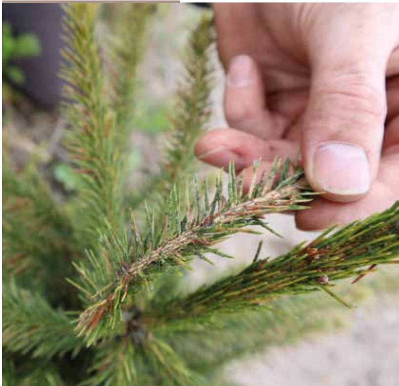
Nogle af de små rødgraner har været plaget af bladlus i forsommeren.