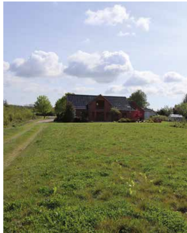
Skoven er designet sådan, at der friholdes en bred lysning foran stuehuset. Det sikrer, at der også i fremtiden er et godt lysindfald – og et langt kig fra stuehuset.

→ jorden. Derefter kommer vingskær, som skærer ukrudt i hele harvens arbejdsbredde. Til sidst følger en fingerstrigle, som blotlægger ukrudtet og får det til at tørre op, siger han.