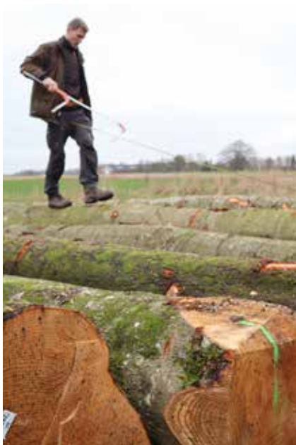
Efterårsmarkedet åbnede op 1. august og er typisk åbent resten af året.

- Hvis vi skover i naturligt foryngede bølgebevoksninger med meget opvækst, kan det være vanskeligere at undgå skader på opvæksten. Om vinteren, når der ikke er løv på træerne, er det langt nem-