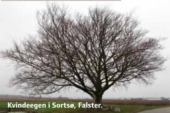
Kvindeegen i Sortsø, Falster.