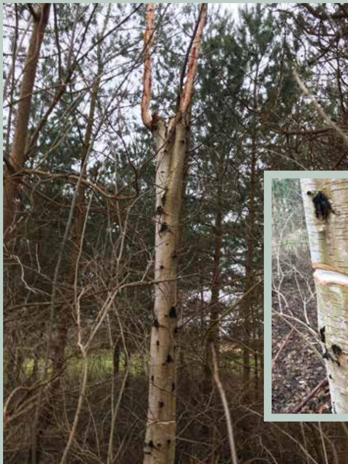
Når man laver en højstub, skal man huske også at ringe træet, ellers risikerer man som her, at det bare skyder igen, og så er man lige vidt, hvis det var ambitionen at lave et "hurtigt" spættetræ.