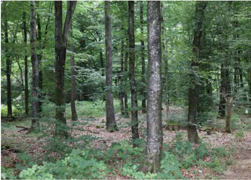
Skoven består af blandet løv og nål. Bøgebevoksningen er sået med hollandske frø, som den tidligere skovfoged Ravn importerede.

- Jeg var ikke et sekund i tvivl om, at jeg ville købe skoven. Jeg kendte området lidt, og det var tilstrækkeligt for mig, uddyber han.