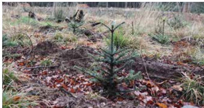
Skovbevoksninger tæller med som dyrket areal.

Vær også opmærksom på, at indberetningssystemet SJI indeholder en risiko for at indberette brug af ikke godkendte midler.