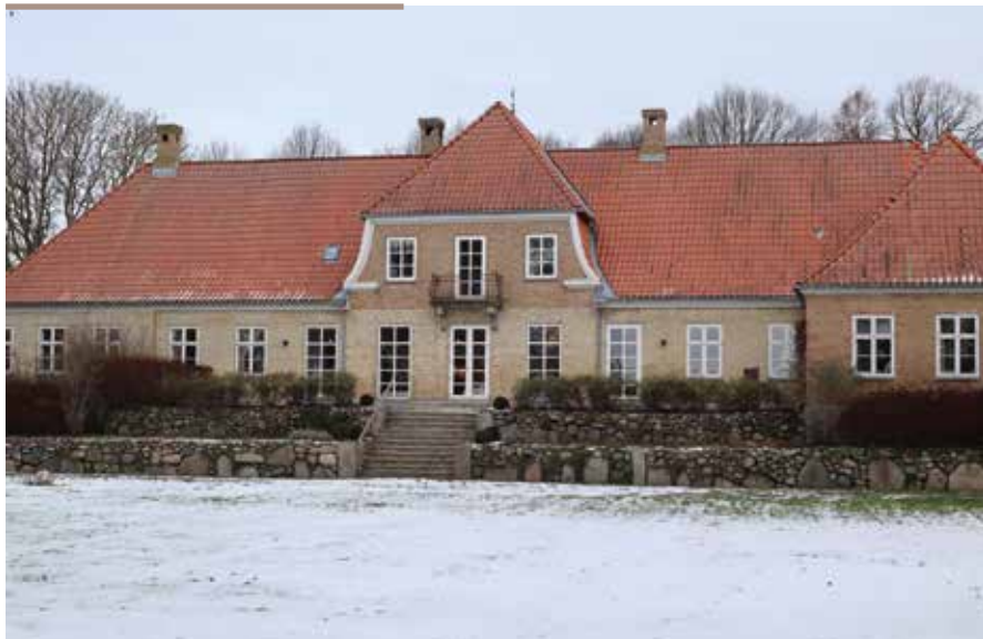
Hovedbygningen på Havnø Gods ligger med udsigt ned over Mariager Fjord.