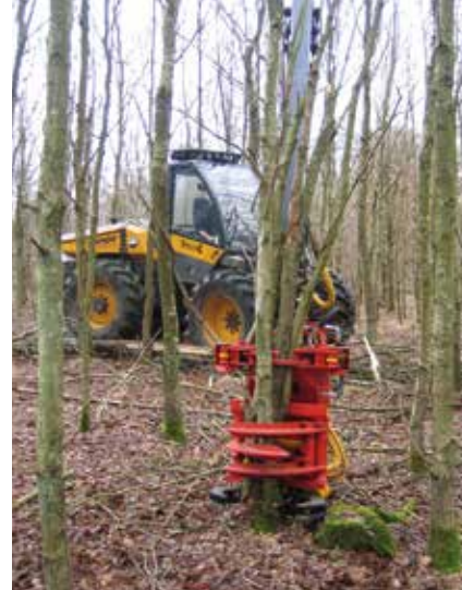
Tynding til flis i 18 år gammel eg. Skovningsmaskinen er udstyret med et aggregat til fældebunkelægning. Der indlægges kørespor og tyndes mellem disse i en operation. Det øger udtaget væsentligt og forbedrer økonomien.

Opkvistning og beskæring gøres bedst i sensommeren, hvor træet endnu gror og kan begynde at lukke såret med det samme.