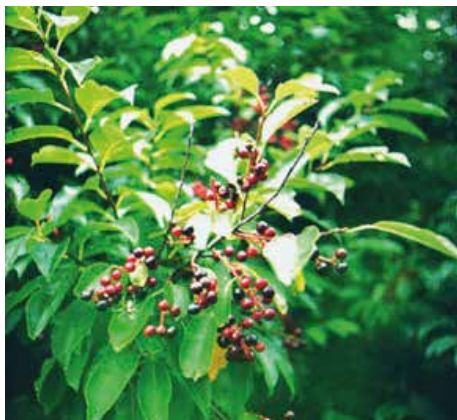
Handel med glansbladet hæg og rynket rose er blevet forbudt.

Rynket rose og glansbladet hæg er invasive arter. Der er nu indført forbud imod at handle med de to arter. Det skete fra første januar i år.