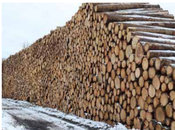
Det seneste efterår blev der skovet fire hektar 40-årig sitka. Det kom der 1600 kubikmeter råtræ ud af plus flis.