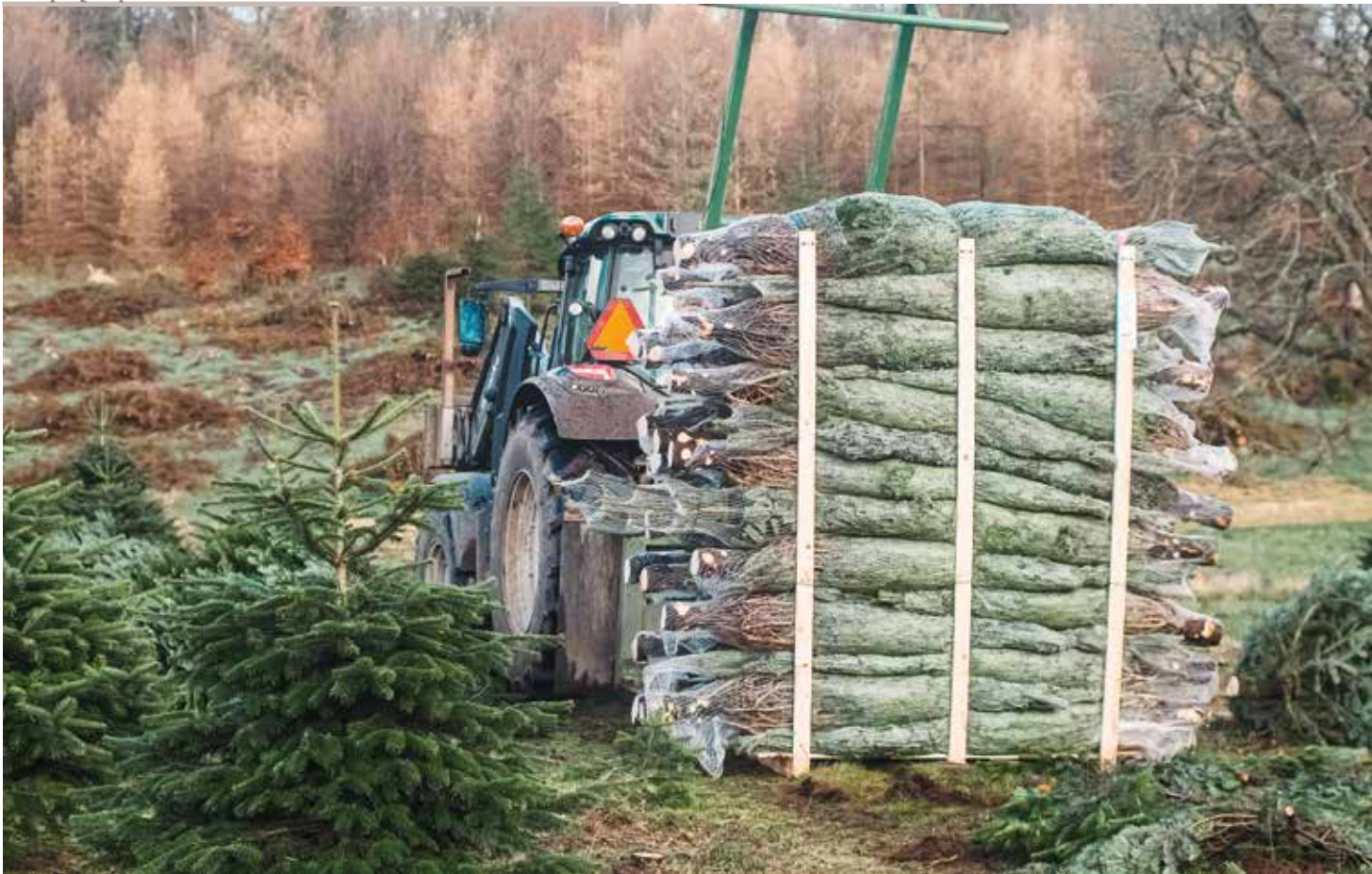
Green Product har solgt flere juletræer end sidste år. Samtidig er de mange års prisfald stoppet.