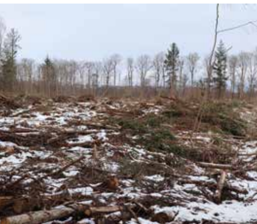
Til foråret bliver der genplantet sitka på det afdrevne areal.

- På den måde er vi lykkedes med at få solgt en fornuftig andel askekævler, siger hun.