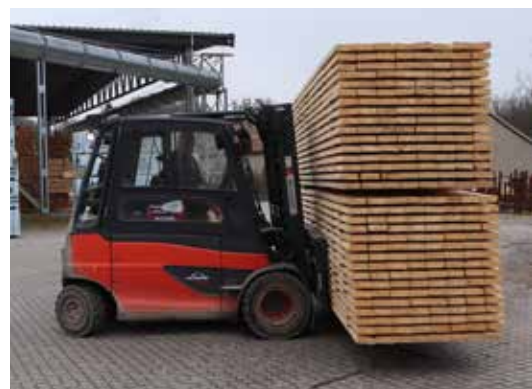
Priserne på nåltræ er usædvanligt høje, og der er stor efterspørgsel fra savværker.