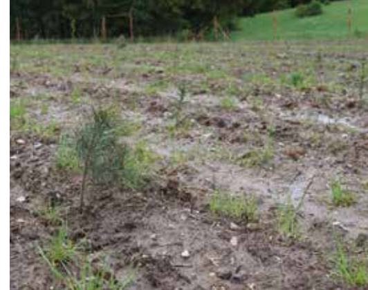
Skovrejsning som forretningsområde vokser - godt hjulpet på vej af statens tilskudsordninger og stor interesse for at plante træer mod klimaforandringer.