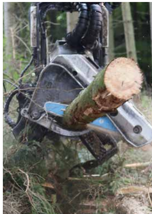
Råtræmarkedet var brandvarmt i 2020/2021, og skovningsaktiviteten var derfor usædvanlig høj.