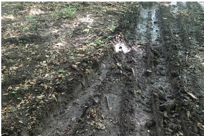
De store maskiner sætter spor i skovbunden og på skovveje, nærmest uanset vejrforholdene.

Der anvendes stort maskineri til flisprojekter og man må forvente, at maskinerne vil lave hjulspor i bevoksningerne og på stikspor og skovveje. Efter hugning af flis ligger der altid grenrester, nåle og flis tilbage i skoven og på huggepladsen. Vær forberedt på at veje og spor måske skal renoveres efter flisprojektets afslutning og at dette ikke indgår som en del af flisopgaven.