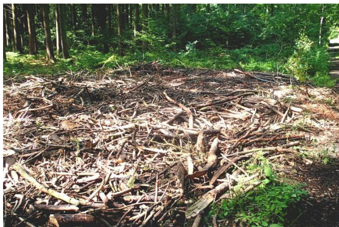
Når flisprojektet er afviklet vil der altid ligge grene, nåle og flisrester tilbage. Knusning/fjernelse af dette efter flisprojektets afslutning, indgår ikke som en del af flisopgaven.