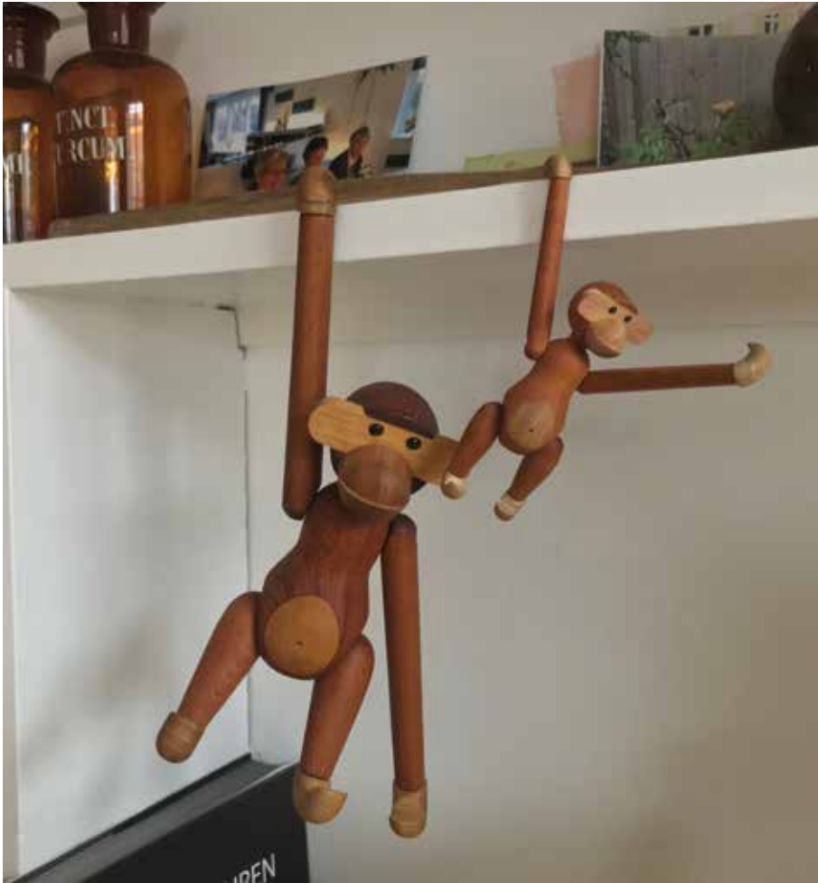
Kaj Bojesen er i særdeleshed kendt for sin abe, som findes i rigtig mange hjem ikke bare i Danmark. Mange andre dyr og andet kunsthåndværk er det i tidens løb blevet til. Fine stykker der er blevet til samlerobjekter.