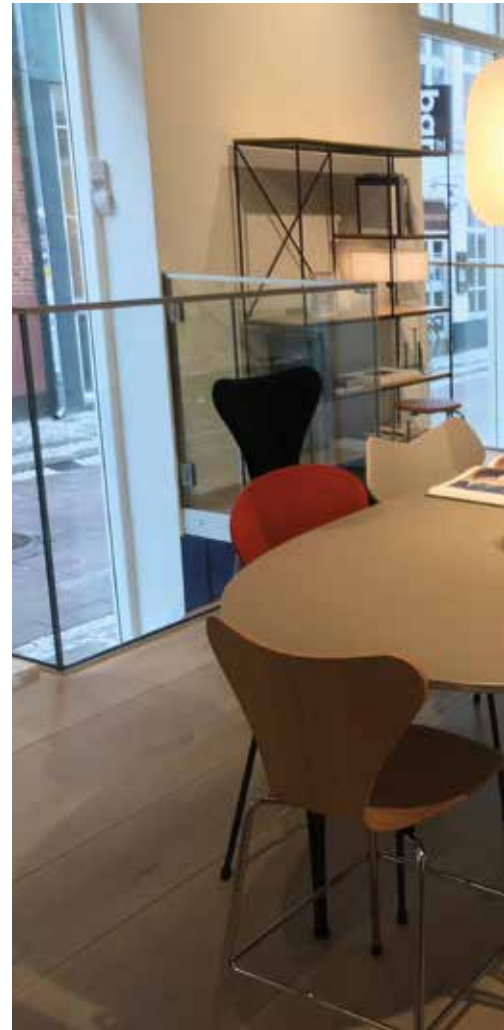
Danish Design. Her ses bl.a. Arne Jacobsens 7'er stole og Piet Heins superelipse bord.