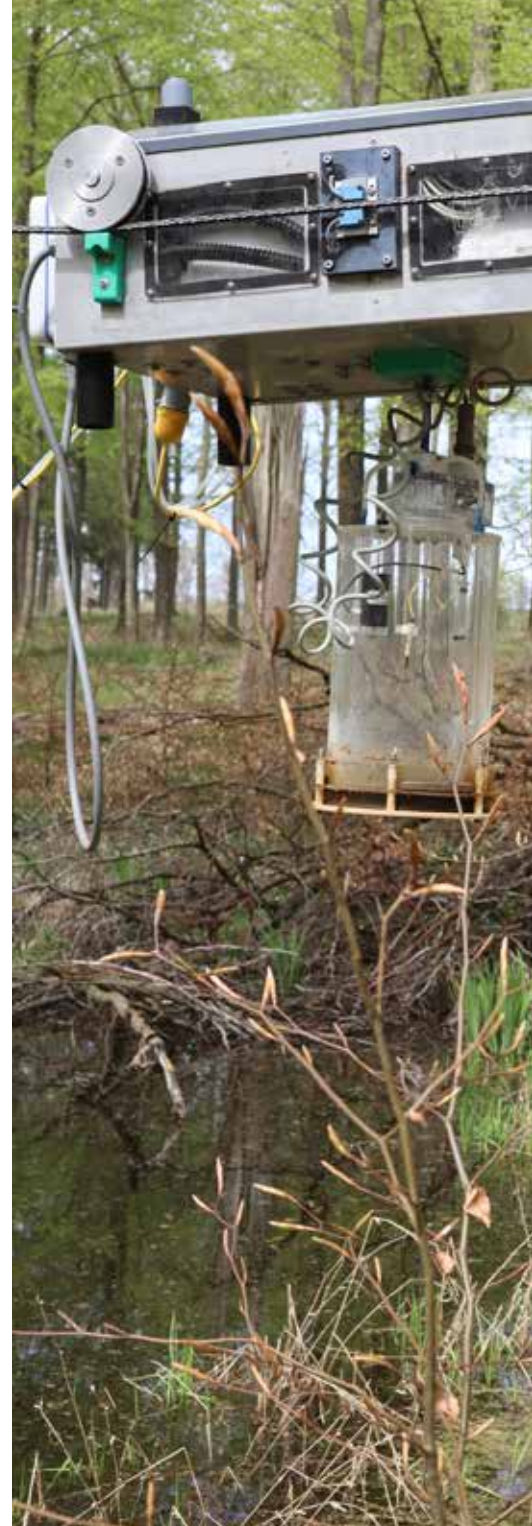
Et lille køretøj ruller afsted på to reb. Fra fastlagte positioner sænkes tryktanken ned i skovbunden og registrerer udledning af klimagasser.

- Det, som interesserer os, er udviklingen af klimagasserne i de nu genopfug-