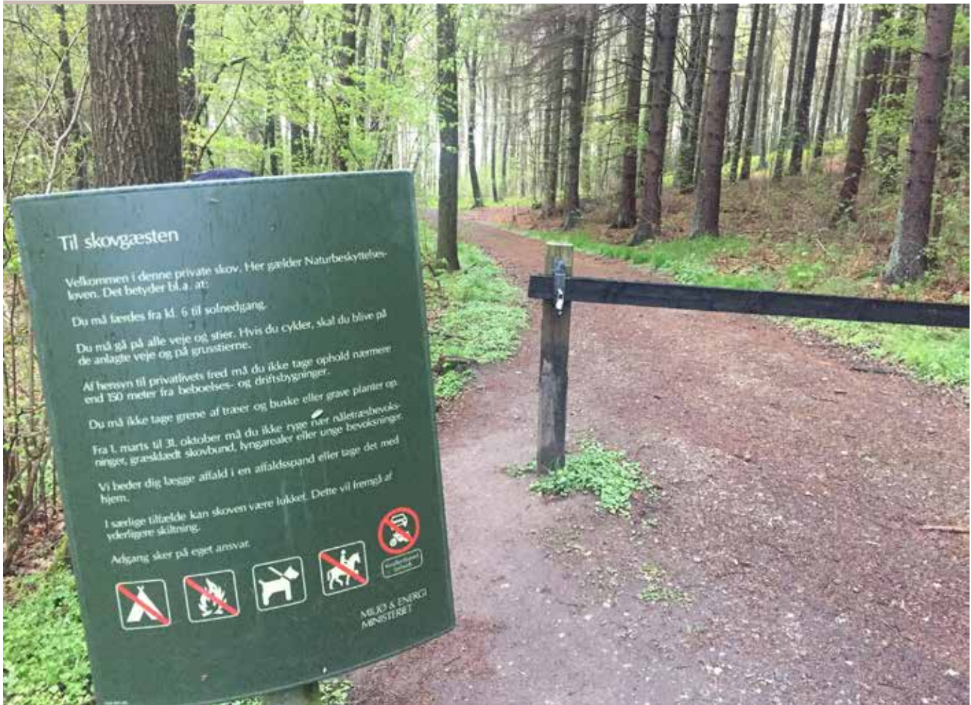
Skovejere kan gratis bestille de grønne velkendte adgangsskilte hos Dansk Skovforening.