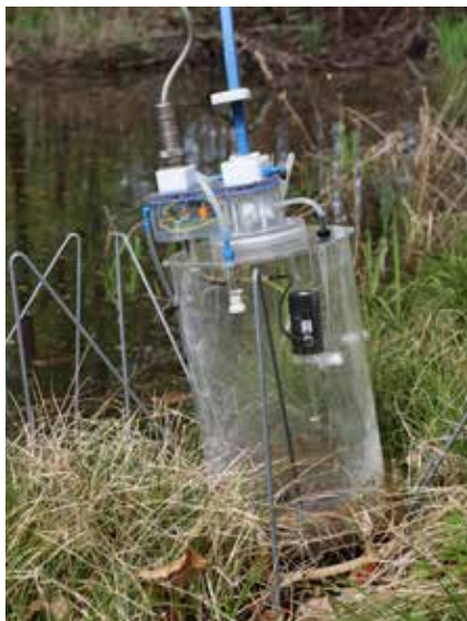
Tryktanken registrerer udledningen af klimagasser i skovbunden.

Målingen varer omkring 10 minutter. Motoren snurrer igen, og køretøjet ruller frem til næste målepunkt.