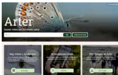
Screendump fra arter.dk.

- Arter bliver et værdifuldt redskab i natur-