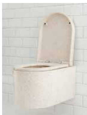
Det finske firma Woodio er klar med et toilet, der er fremstillet af træ.

Det moderne, vægmonterede toiletsæde er designet ud fra skandinavisk form og funktion,