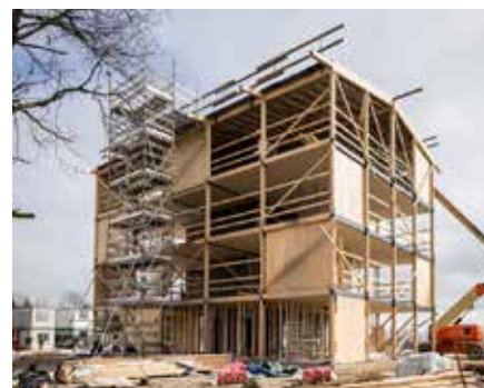
Forårets aftale om den nationale strategi for bæredygtigt byggeri er godt nyt for træbyggeriet.