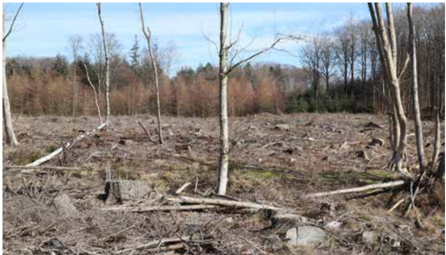
Skovdyrkerne har ryddet et stort område, hvor der nu skal lukkes grøfter og etableres naturlig hydrologi. Området skal blive til skovmose.