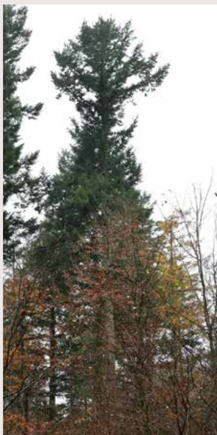
Danmarks højeste træ er en douglas ved Silkeborg. Her er træet fotograferet en diset dag i november 2017.

Landets højeste træer står typisk i Midtjyl-