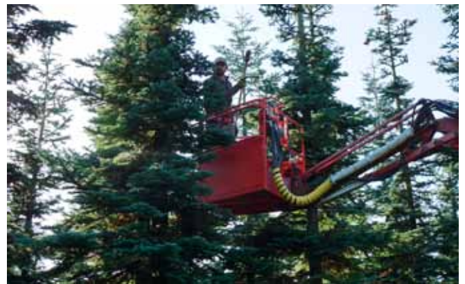
Liftklip af ældre bevoksning af nobilis. De nedklippede grene sorteres og bundtes af mandskabet på jorden.

Et afgørende moment for en grøntsæson er afslutningen – det er ofte her, der kan sættes penge til i handelsleddene – og det er her man tager det første afsæt for den kommende sæson. Vi oplevede heldigvis en god og velordnet nedlukning af det sene, hollandske marked.