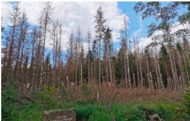
Angreb af barkbiller har været deprimerede hårde ved de europæiske skove. Som her i en engang smuk rødgranbevoksning i Harzen.

Som altid får højkonjunkturer en ende og denne gang var det overudbud, der var årsagen. Den bagvedliggende forklaring var de betydelige tvangshugster af billeskadet træ i store dele af Europa. Også i Danmark så vi, hvorledes 2018-tørken banede vej for alvorlige typografangreb – men for det første har vi slet ikke rødgran i de arealklasser, man ser i fx Sverige og Tyskland og for det andet fik vi håndteret situationen, inden den voksede os over hovedet. Det var ikke muligt i Tyskland og flere steder i Centraleuropa. Resultatet har været massive skader – man taler om et tvangsudbud på 100 mio. m 3 billetræ fra Tyskland alene. Det kan sættes i perspektiv i forhold til en dansk normalhugst af nåletræ på måske 3-3,5 mio. m 3 .