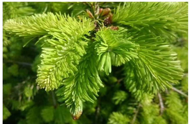
Billede 4: Skud efter nipning/skudafbrækning

Øerne Tlf: 62 62 47 47 oer@skovdyrkerne.dk Vestjylland Tlf: 96 10 10 96 vest@skovdyrkerne.dk Syd Tlf: 75 86 73 88 syd@skovdyrkerne.dk