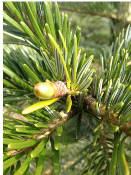
Billede 1: knopsætning året efter nipning

Ulempen er, at træet kan få et hængende udseende, og at metoden reducerer grenenes egnethed til at bære lys. Præstationen for øvede er 100-150 træer/time ved en gennemsnitlig træhøjde på 1 meter.