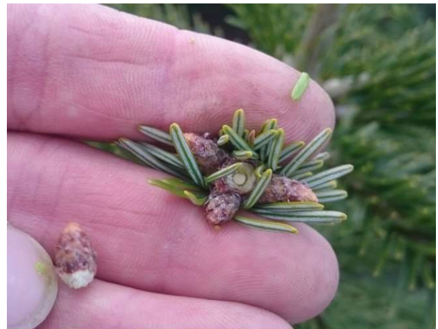
Billede 2: Afpillet knop

Ulemperne er, at man færdes i kulturen i den sårbare udspringsperiode, samt at det skal foretages inden for et kort tidsrum.