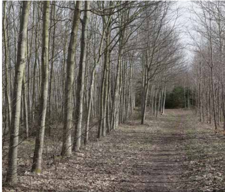
Til venstre for sporet er der plantet rødege og til højere er det stilkeg. Den større tilvækst hos rødegen er tydelig.

⇒ - Vi mødes til et årligt rådgivningsbesøg. Her taler vi om kommende projekter. Jeg har spraydåsen med rundt, så vi kan markere udtyndingstræer ved samme lejlighed, siger han.