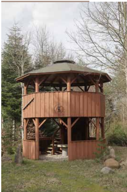
Naturværdier og herlighed har høj prioritet. Der er anlagt sø og fugletårn.