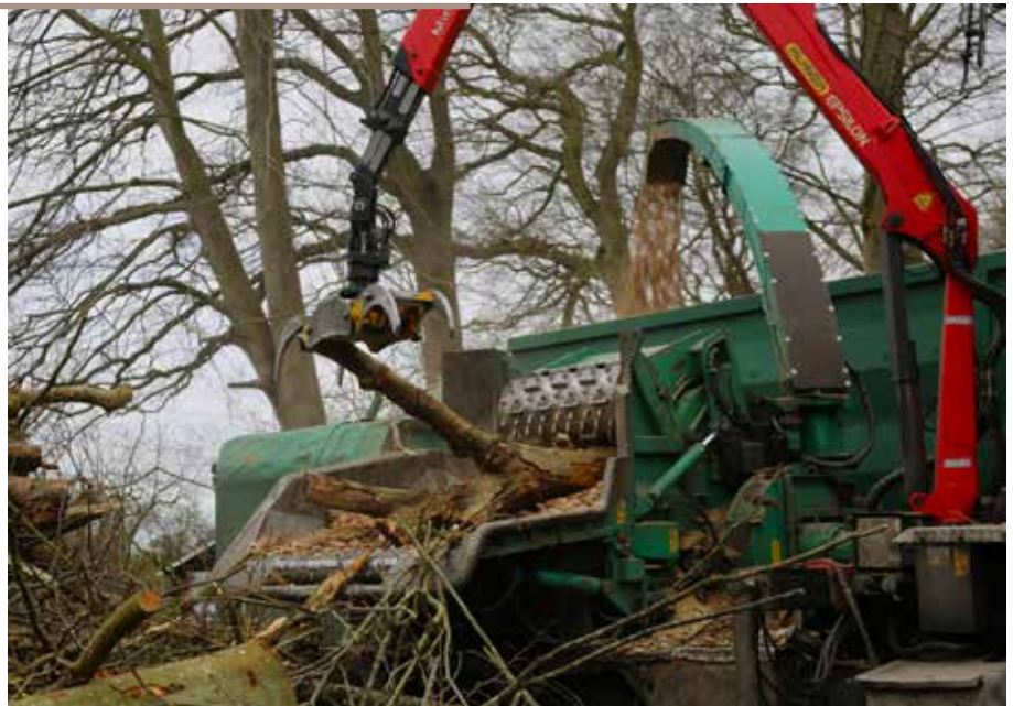
Flisproduktionen gør tyndings-operationerne rentable. Med flisproduktion udnytter man skovens restprodukter – uanset træart, dimension og kvalitet.

- I det hele taget skal man tænke langsigtet og ud af boksen, for regn kommer der ikke mindre af.