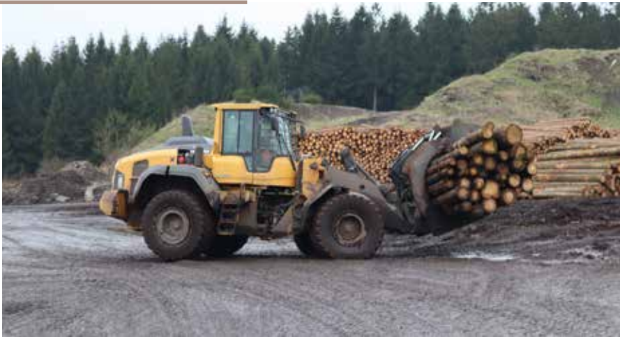
En lang række af skovens produkter bliver overset i statistikkerne, påpeger professor.