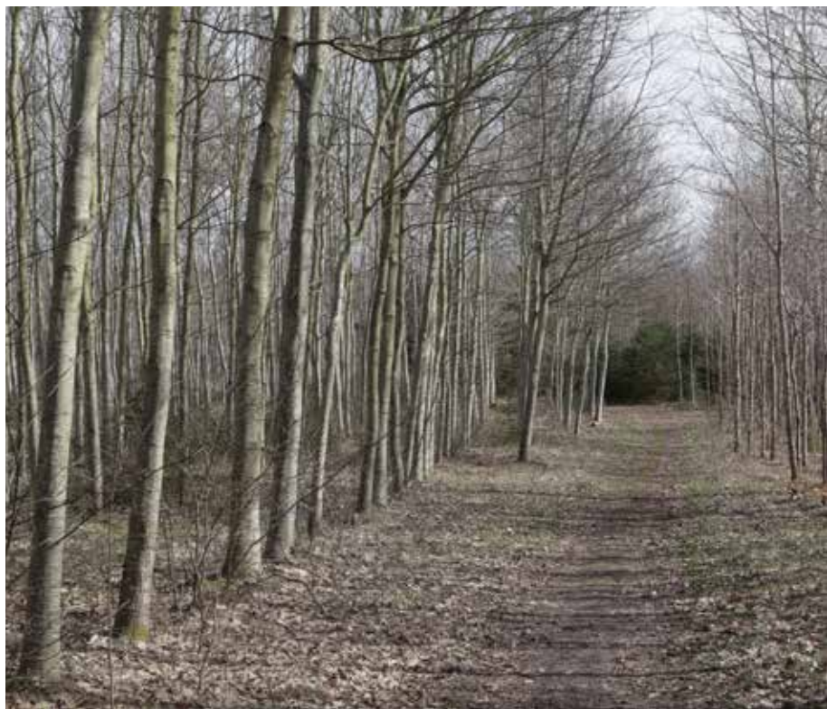
Til venstre for sporet er der plantet rødege og til højere er det stilkeg. Den større tilvækst hos rødegen er tydelig.

⇒ - Vi mødes til et årligt rådgivningsbesøg. Her taler vi om kommende projekter. Jeg har spraydåsen med rundt, så vi kan markere udtyndingstræer ved samme lejlighed, siger han.