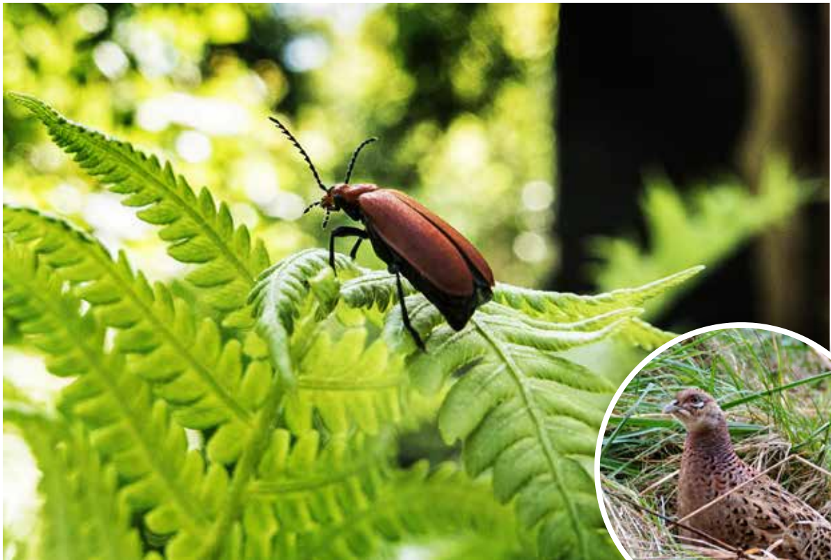
Insekter udgør en stor del af fødegrundlaget for fasanekyllinger og agerhønskyllinger, der derfor også vil tiltrækkes af biotopen.

følgelig hjemmehørende arter som kornel, slåen, dunet gedebled og roser som æblerose og hunderose. Når det kommer til træer, skal man vælge lystræer som ask og eg. Det er træer, hvor der slipper meget lys ned gennem trækronen til skovbunden, hvilket giver mulighed for, at buskene kan trives.