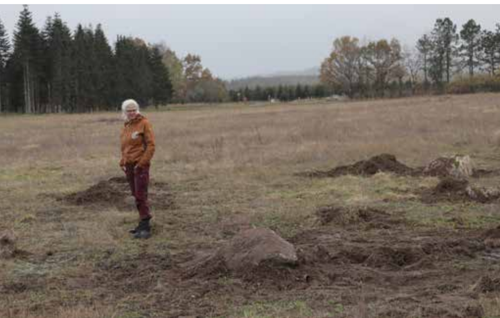
Store sten er blevet nedgravet på ejendommen. Stenene varmes op af solen til gavn for krybdyr.

- Vi har fået lagt de store sten ud på vores arealer som et af de seneste tiltag. Nogle af stenene har vi fået gravet delvist ned. Store sten bliver varmet op af solen, og er en vigtig varmekilde for krybdyr og