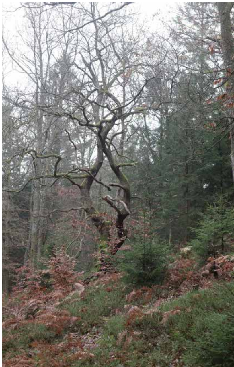
Der er i alt blevet udpeget omkring 13.000 hektar paragraph 25-natur. Udpegningen er stort set afsluttet.

Har du spørgsmål vedrørende en udpegning, er du velkommen til at tage fat i din skovfoged ved Skovdyrkerne.