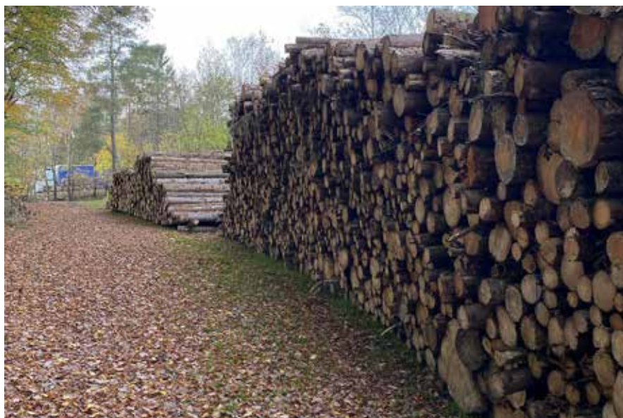
Forvaltningen af nye og eksisterende skove er rykket ind under ministeriet for grøn trepart.