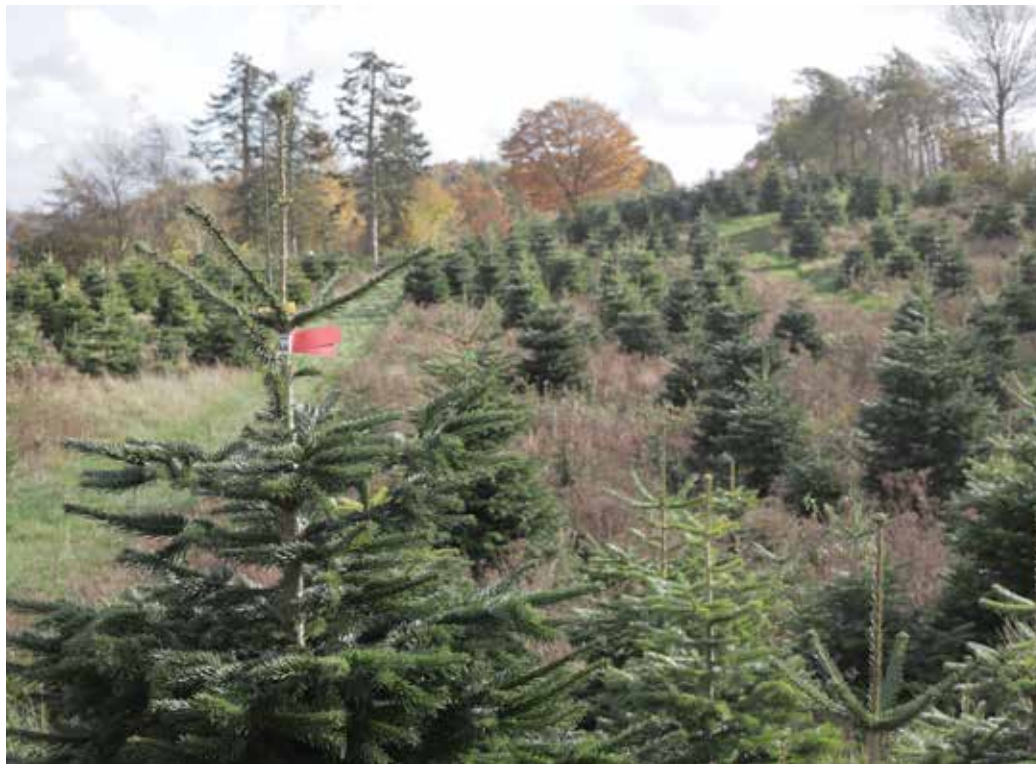
Der produceres gode træer med løbende indplantning.