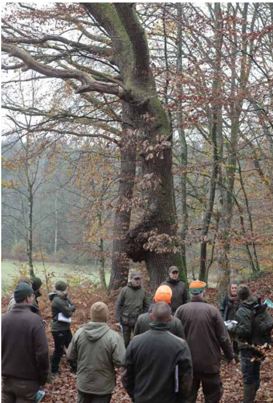
Skovdyrkernes skovfogeder fik ny viden om udpegningen af paragraf 25-natur i skovene.