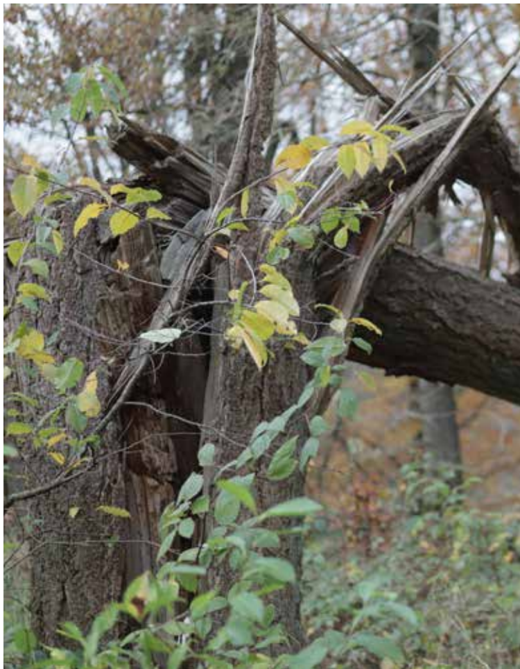
Væltede træer får lov til at blive liggende.

kunne nyde naturen og få lov til at eksperimentere med biodiversitetstiltag i praksis. Derfor slog vi til med det samme, da vi så denne ejendom, siger hun